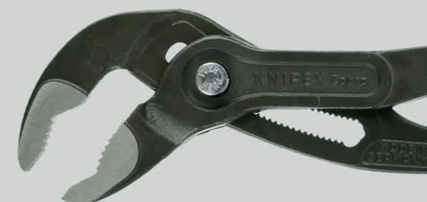
Čeluste fosfátované a tramentolom