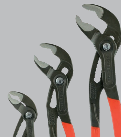
Pre rúrky: Ø 42 Ø 50 Ø 70 mm