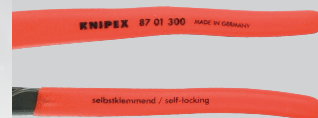
Rukoväť potiahnutá plastom pre lepší úchop