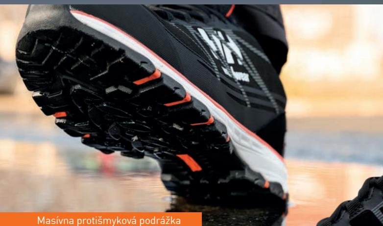
Masívna protišmyková podrážka

2x KONDENZAČNÝ KOTOL alebo 1x TEPELNÉ ČERPADLO